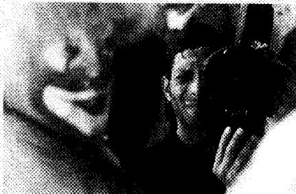
Alcuni momenti della performance dei detenuti della Compagnia della Fortezza di Volterra .