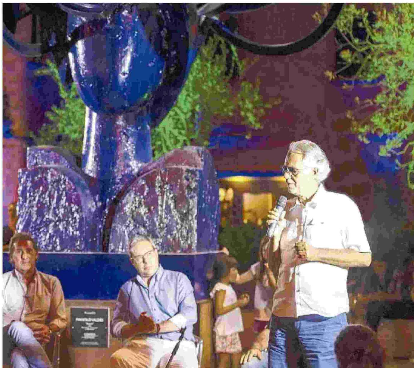
Il maestro Andrea Bocelli in piazza a Lajatico