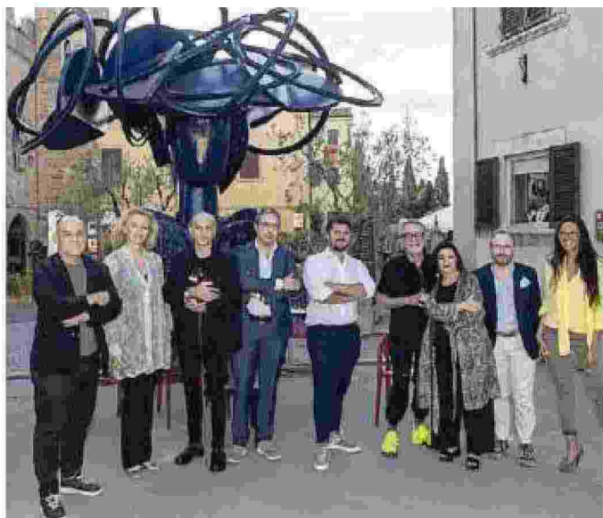
Promotori e protagonisti degli eventi estivi di Lajatico