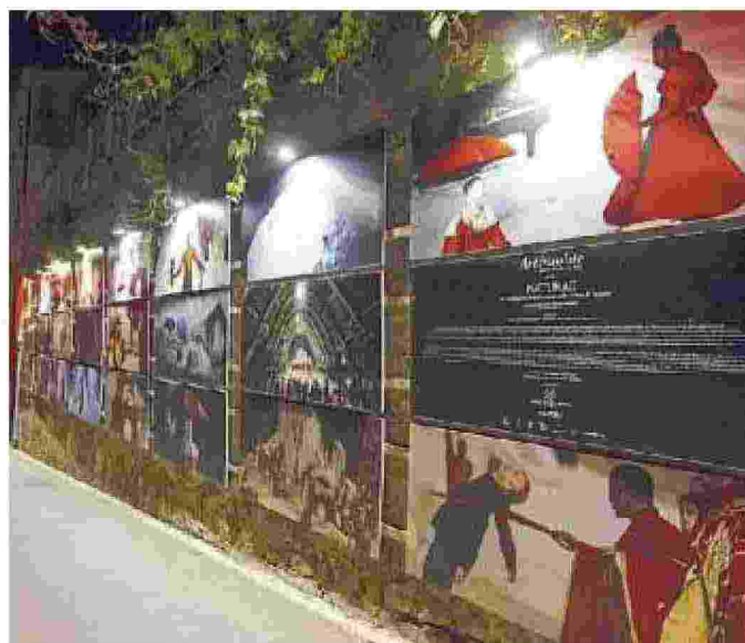
La magia delle foto di Naturae per ArtInsolite nel borgo di Lajatico

Ritaglio stampa ad uso esclusivo del destinatario, non riproducibile.